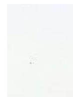
Per Sefland (Varamedlem)