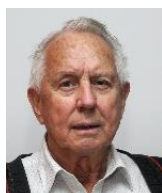
Per Staff (Styreleder)