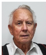
Per Staff (Styreleder)