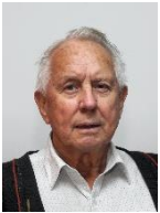
Per Staff (Styreleder)